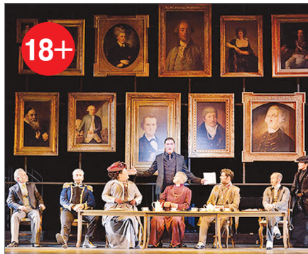
23 ФЕВРАЛЯ В 19.00 МЮЗИКЛ «ДЖЕКИЛЛ И ХАЙД»

ВЫДАЧА БИЛЕТОВ будет осуществляться с 13 февраля 2019 года, с 9.00 до 18.00, по адресу: пр. Луначарского, д. 80, корп. 1, лит. Б, кабинет № 6. При себе необходимо иметь паспорт с отметкой о регистрации на территории МО МО Северный КОЛИЧЕСТВО БИЛЕТОВ ОГРАНИЧЕНО!