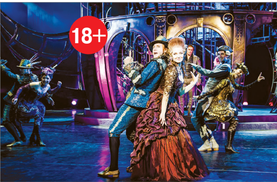
16 ФЕВРАЛЯ В 19.00 МЮЗИКЛ «ГРАФ МОНТЕ-КРИСТО»

Красочный масштабный мюзикла Фрэнка Уайлдхорна в двух действиях Граф Монте-Кристо, по мотивам одноименного романа Александра Дюма, на сцене Санкт-Петербургского государственного театра музыкальной комедии.